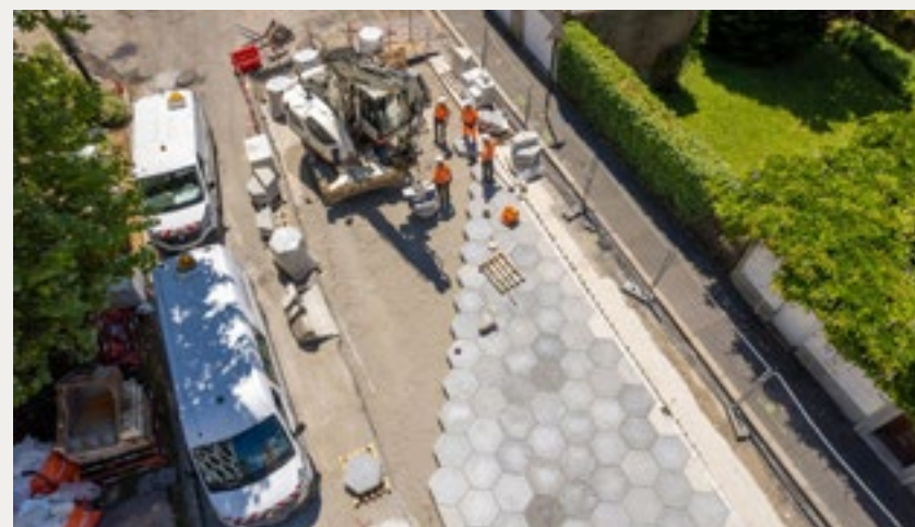
Le démonstrateur de CUD-SF de Nantes en cours de montage vu du ciel.

Pour répondre à ces problématiques tout en s'inspirant d'un programme de recherche sur un concept innovant de chaussée urbaine démontable (CUD) piloté par le Laboratoire des Ponts et Chaussées (LCPC) entre 2003 et 2008, l'université Gustave Eiffel a développé un nouveau concept de CUD à surface fonctionnalisée : CUD-SF.