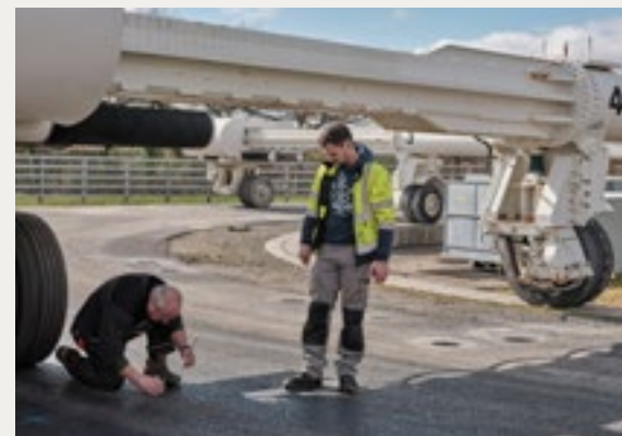
Bâtiment Viarme du LCPC - Nantes

Le manège de fatigue est un grand équipement d'essais accélérés sur chaussées. Situé sur le campus de Nantes de l'Université Gustave Eiffel, il permet de tester à échelle un, en temps réduit, la durabilité de solutions constructives des chaussées.