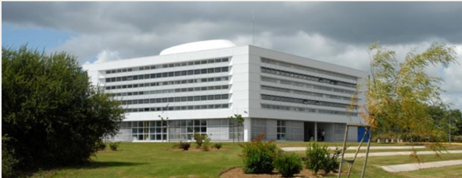
Bâtiment Viarme du LCPC - Nantes