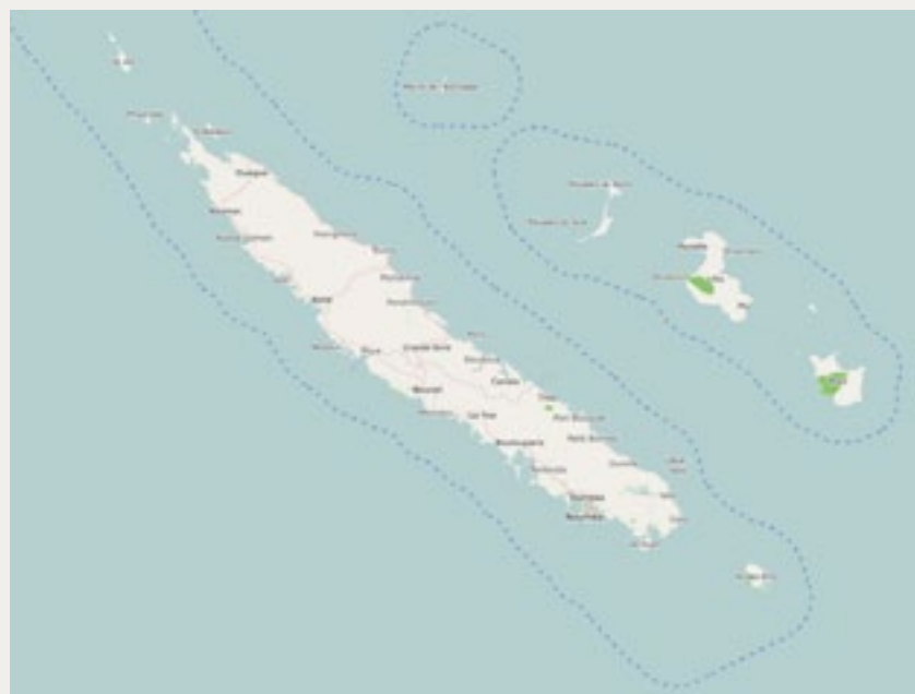
Carte de la région de Nouvelle Calédonie

L'évaluation environnementale et territoriale est réalisée au sein de la fédération de recherche IRSTV, et portée par une équipe projet transdisciplinaire entre le Laboratoire d'Économie et de Management de Nantes-Atlantique (LEMNA), l'ESO (UMR Espaces et Sociétés) et l'Université Gustave Eiffel.